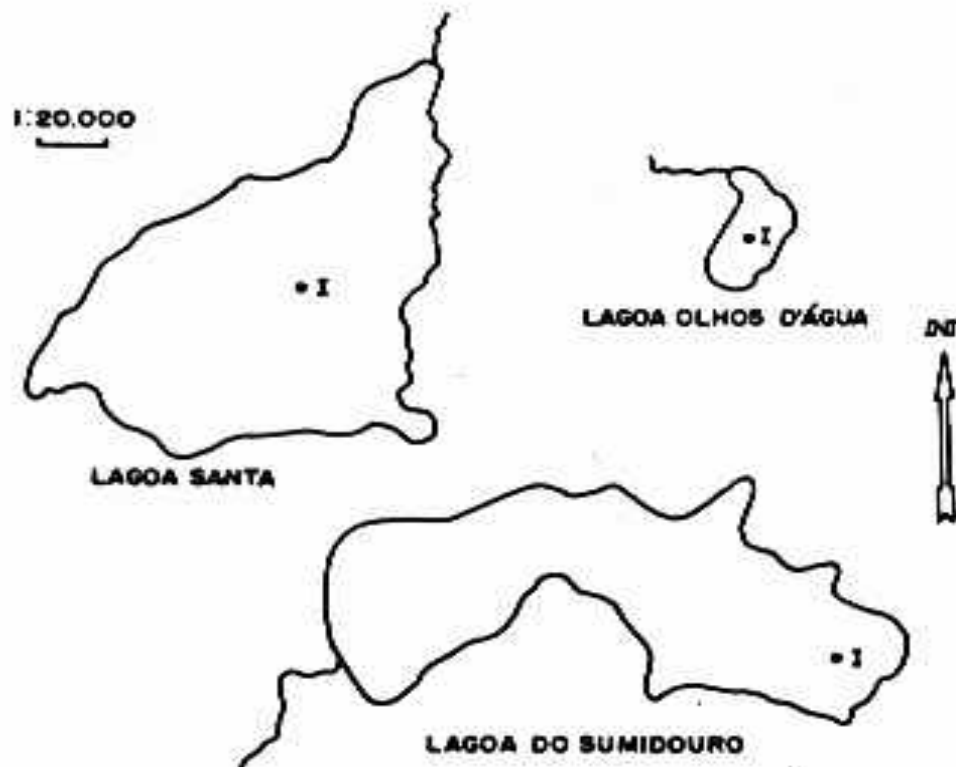
Figura 1 - Mapa morfométrico da Lagoa Olhos d'Água, Lagoa Santa e Lagoa do Sumidouro, mostrando a estação 1 de coleta.

A Fig. 1 mostra o mapa de contorno dos 3 lagos, com a localização das estações de coleta do sedimento.