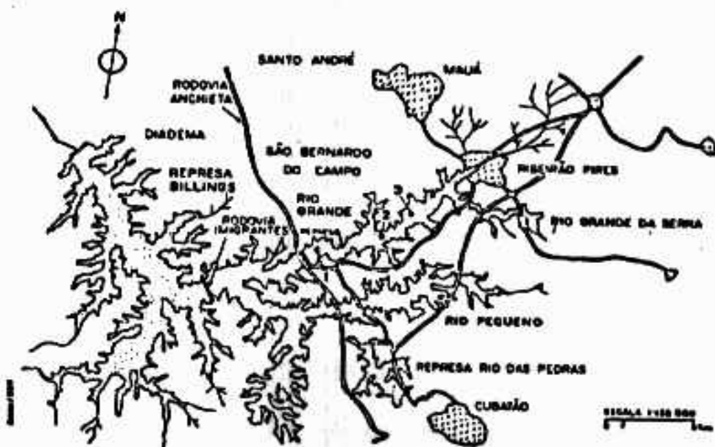
Figura 1 - Mapa da Represa Billings com as três estações de coleta no Rio Grande.

Foram selecionadas três estações de coleta (fig. 1), sendo que a primeira é a mais próxima da barragem (1km) e da Estação de Tratamento da Água (ETA) da SABESP e a terceira é a mais distante da barragem (10km) e recebe água dos rios principais, Rio Grande e Ribeirão Pires. O local entre as estações 1 e 3 que segundo Maier et al. (1985) apresentou resultados intermediários das análises químicas e biológicas, foi escolhido como estação 2.